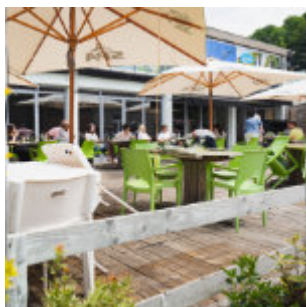
Aankomst van de kajaks

GENIET VAN EEN HEERLIJKE MAALTIJD IN ONZE ACCOMODATIE (P. 11) OF IN EEN VAN ONZE SPECIALE RUIMTES.