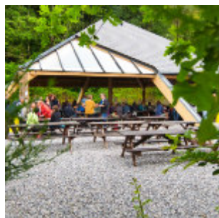
In Dinant Aventure