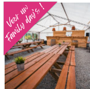
De Avontuur vlakte

ONTDEK ONZE VERSCHILLENDE MENUKAARTEN EN RESTAURANT LOCATIES OP