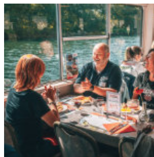
Op een boot